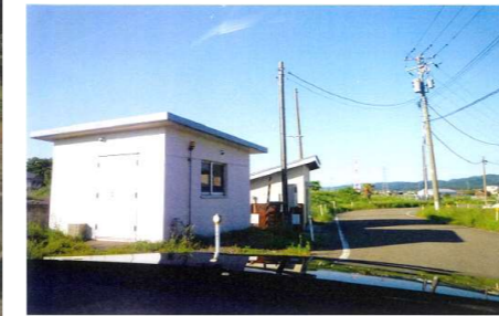
河川ポンプ施設があります。