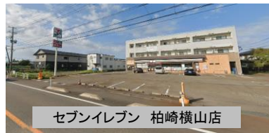
セブンイレブン 柏崎横山店