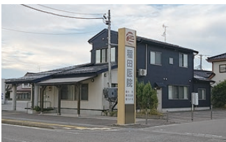
稲田医院様…徒歩約5分