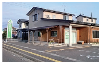
高橋医院様…徒歩約5分