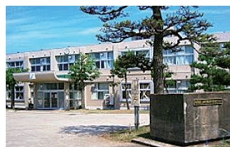
柏崎翔洋中等教育学校…徒歩約8分