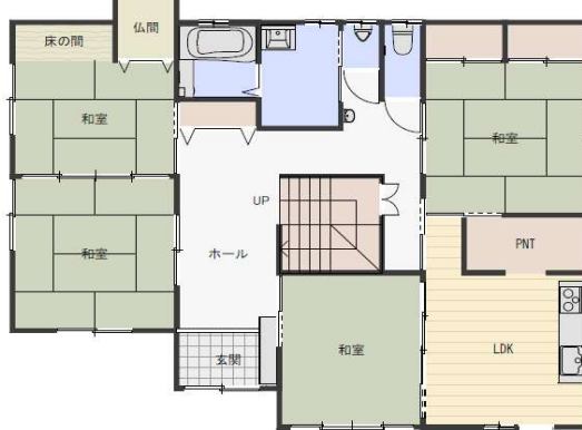
間取り図1階 ※図面と現況が異なる場合は、現況を優先いたします