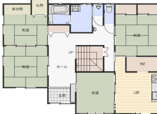
間取り図1階 ※図面と現況が異なる場合は、現況を優先いたします