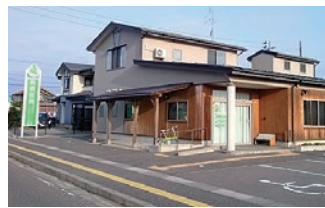
高橋医院様…徒歩約5分