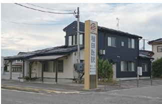
稲田医院様…徒歩約5分