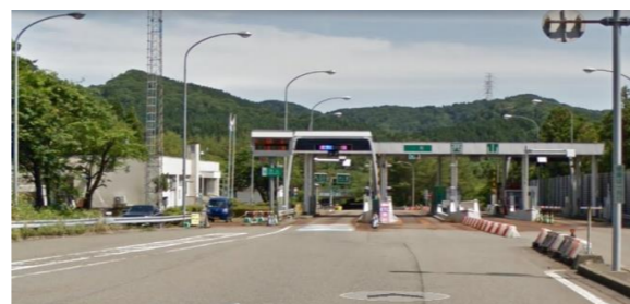
西山インターチェンジ